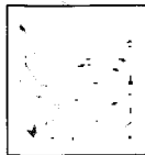
Gesichtshaut mit gutem Zellstoffwechsel und viel Feuchtigkeit ist glatter und straffer